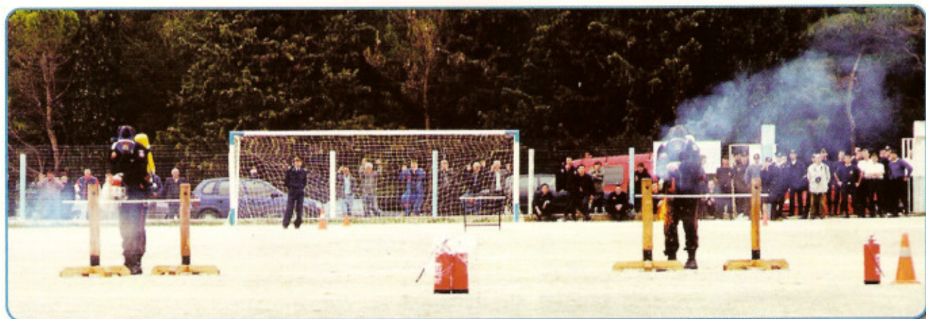
Αγώνας κατάθεςης πυρκαχιάς με χρήση πυροσβεστικών εργαλείων και μέσων