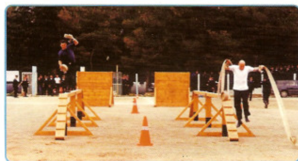
Αγώνας 100m με πυροσβεστικά εμπόδια