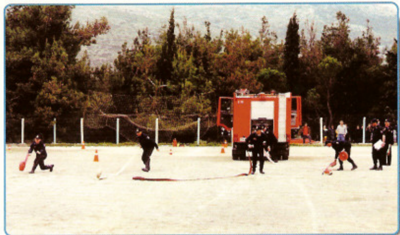
Αγώνας ταχύτητας και τεχνικής εκκαταστάσεων ύδατος